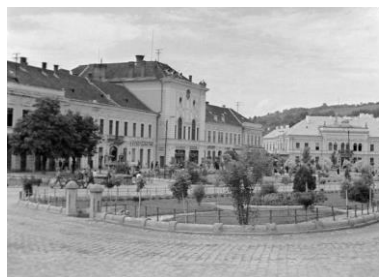
A régi központ a színház, kaszinó és vármegyei székhely épületével

1897 júniusában megnyitják a Népkertet, ugyanebben az évben felépül a színházterem és a kaszinó is a lakosság szórakozási lehetőségeit biztosítva.