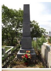
Örök nyughelye a zilahi temetőben

Élete végéig szolgálta szülőföldjét. 72 évesen 1897. augusztus 31-én szűnt meg dobogni a szíve.