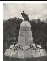
A Milléniumi emlékmű

A Wesselényi szobor valamint a Milléniumi emlékmű felállítására is az ő nevéhez fűződik.