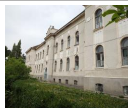
A közkórház épülete ma

Alispánságának kimagasló eredménye a vármegyei közkórház felépítése és működtetése. Építéséhez 1891-ben fognak, és 1894. január 1-én nyitják meg 100 ágygal.