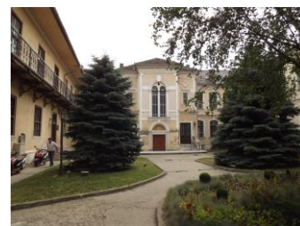
Az újjáépített vármegyei székhely és törvényszéki palota

1897 júniusában megnyitják a Népkertet, ugyanebben az évben felépül a színházterem és a kaszinó is a lakosság szórakozási lehetőségeit biztosítva.