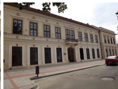
A színház valamint kaszinó épülete ma.

Alispánságának kimagasló eredménye a vármegyei közkórház felépítése és működtetése. Építéséhez 1891-ben fognak, és 1894. január 1-én nyitják meg 100 ágygal.